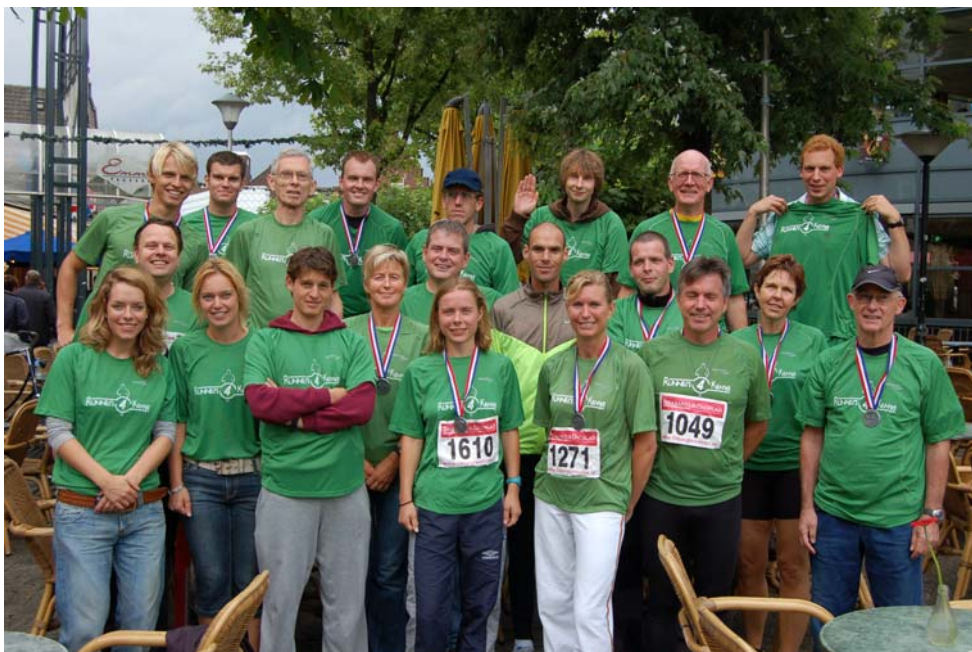
een deel van de 100 Runners4Kenya tijdens de Tilburg Ten Miles van 2008-10-04