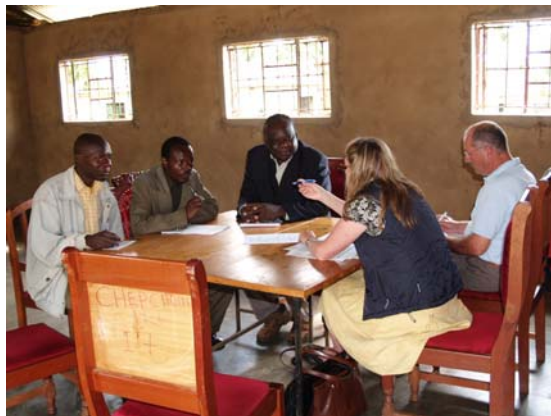
overleg met bestuur Chepchoina basisschool