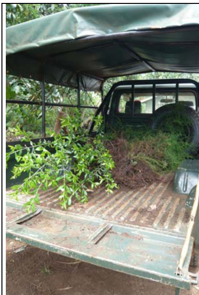
Jonge aanplant op weg naar de school

Terwijl Ad rond en in de school druk bezig was, reed ik rond voornamelijk met de jeep (voor de kenners: 'n Toyota Land Cruiser). Ik was de driver en moest o.a. in Chepchoina (5 km verderop) bij een bomenkwekerij 400 jonge cipressen en 900 jaccaranda's gaan halen. Deze moesten allemaal nog uit de grond gehakt worden, dus nam ik steeds 6 van die sterke jonge keniantjes mee van 'n jaar of 16/18 (maar wel achter in de bak natuurlijk). Die kwekerij lag tussen enkele hutjes in de middle of nowhere. Ik dus met die jeep door de maïsvelden (overal staat momenteel mais) over steeds smaller wordende paadjes, geweldig (dacht dat ik hier nooit meer uit zou komen).