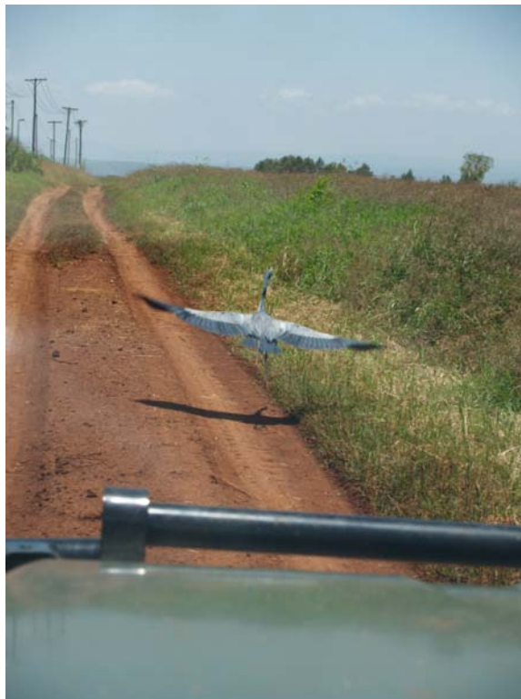
We storen een blauwe reiger

Het werd een 1,5 uur durende rit, terwijl die anders hooguit 1 uur duurt. Door Kitale met al de stalletjes langs de weg, door de vele regen staan ze in en tussen de modderpoelen en waterstromen. Wat een bende is dat. De verharde weg is slecht, sinds ons laatste bezoek in 2006 is er niets aan gedaan. Hele stukken asfalt ontbreken, we rijden langzaam over de best berijdbare delen. Alfred zegt dat hij de binnenweg, dat is dus een zandpad over circa 20 km neemt, de weg over Endebess, ook een zandpad, is zeer moeilijk berijdbaar en soms onmogelijk. Nou de binnenweg is een echte bumpyroad. Waar je soms een bijzondere ontmoeting hebt.