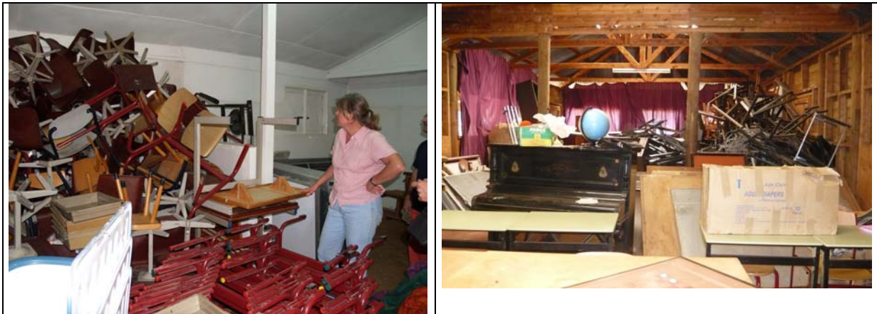
Meubels, meubels en nog meer meubels

De frames van de lessenaars komen ook aan en we beginnen met het monteren van de bladen. Sleutel 6 is nodig om die kleine schroefjes die mijn broer Henk en ik in 2007 allemaal los hebben gemaakt, weer vast te draaien. De jongens zijn daar morgen en overmorgen en.....wel mee bezig.