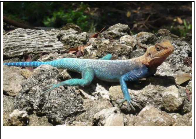
wat een kleurenpracht

Rondom de top is het Mount Elgon National Park en dat gaat op circa 2500 meter over in een enorm landbouwgebied. Dit is de maïsschuur van Kenia. Allemaal kleine boertjes die een stukje grond hebben en maïs verbouwen. Je ziet vrijwel niets anders.