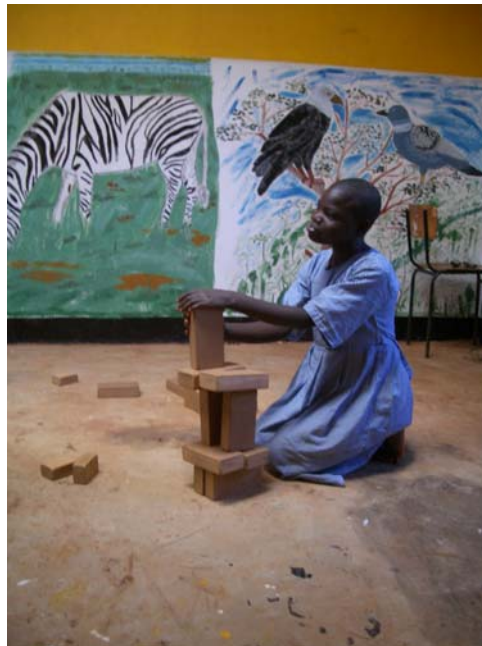
een kleurrijke leeromgeving

Met veel warmte en liefde zijn we ontvangen. Wat een rust en vredigheid om hier te mogen verblijven, Vivaldi en Mozart op de achtergrond, een kopje Thee/Koffie en praten over haar en onze belevenissen en hoe we in de wereld staan.