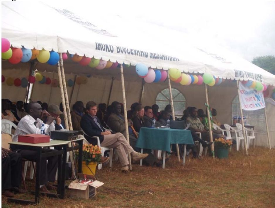
aandacht voor de speeches tijdens de officiële opening van de Highschool op 12 september 2008