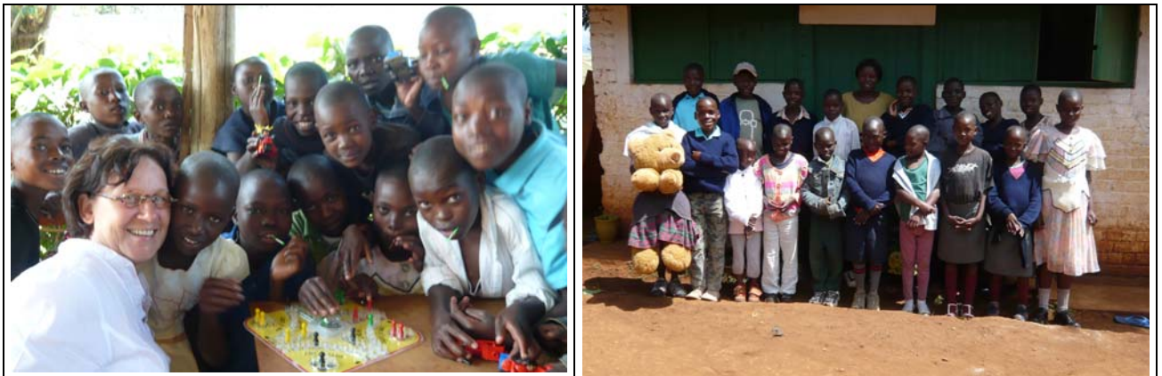
De voorzitter speelt "Mens erger je niet" met de weeskinderen.

Ook heb ik nog wat bezoekjes afgelegd bij enkele vrienden. Wat word je dan toch hartelijk ontvangen. Ze hebben niets, maar hebben er wel voor gezorgd dat ze 'n flesje Fanta voor je in huis (lees "hut") hebben gehaald en 'n paar droge Marie-koekjes of zelfgebrande pinda's (die heerlijk smaken).