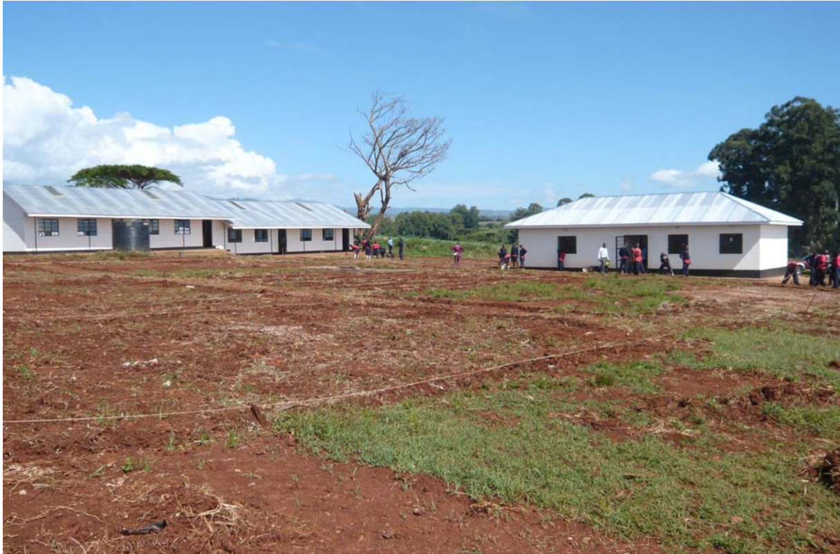
DE ANDERSEN HIGHSCHOOL

Frontaal het administratiegebouw met twee ruimtes voor de schoolmaster van de Highschool en de ambachtschool en rechts de staffroom. Daarin komen de tafels van het MBCollege uit Tilburg. Aan de rechterkant, een groot gebouw (28 x 6meter) bestaande uit de lokalen voor Form 1 A en B en Form 2 A en B. Er is plaats voor 40 leerlingen in iedere klas. Aan de linkerkant, een groot gebouw gelijk dat aan de rechterkant voor Form 3 A en B en Form 4 A en B, ook voor 40 leerlingen ieder. Totaal kunnen er 320 leerlingen de 4 jarige opleiding volgen.