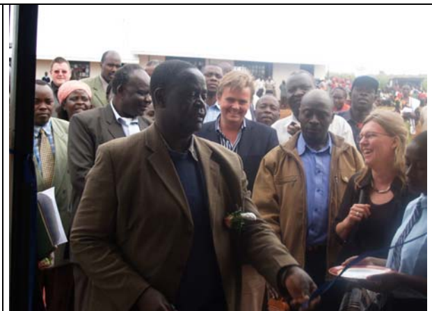
De minister heeft het lintje doorgeknipt.