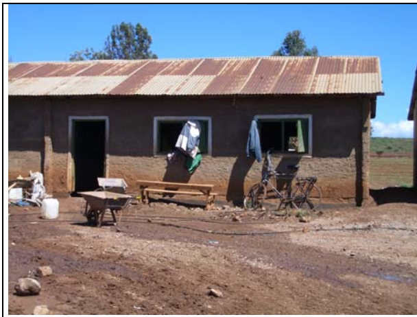
Het nieuwe kleuterlokaal in aanbouw