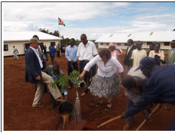
De voorzitter van Elimu plant een Bombax