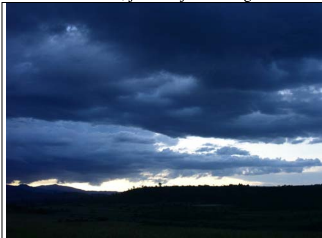
De avond valt over Mount Elgon

De Mount Elgon beheerst dit gebied. Met zijn hoogte van meer dan 4000 meter torent deze dode vulkaan boven de vlaktes uit. De Farm ligt op 2000 meter hoogte op de helling ervan en wordt doorsneden door een rivier. Die rivier (10 meter breed max.) wordt gevoed door de regen die in de krater van de vulkaan valt. Vrijwel iedere avond is het een vuurwerk van jewelste boven die vulkaan. Bliksemflitsen en enorme lichtexplosies zijn dan zichtbaar, je hoort geen gedonder, je ziet in de steeds donker wordende hemel alleen maar lichtflitsen. We worden er stil van, je voelt je zo nietig.