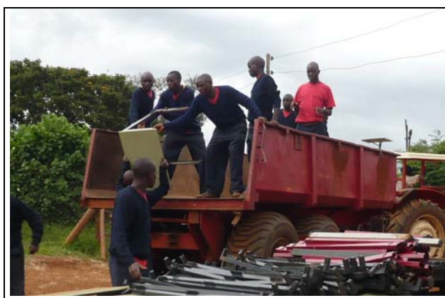
Vervoer van schoolmeubels

Ze egaliseren het terrein, leggen de paden aan met breukstenen van de bouw, maken gaten voor de palen en de bomen, zetten de grond om waar de plantjes moeten komen, maken de lokalen schoon, poetsen de tafels en zo sjouwen we met zijn allen wat af. De verschillende opslagen staat vol met spullen voor hun school en al die spullen gaan nu in de lokalen die nog niet in gebruik zijn. Alles gaat met een tractor waarachter een grote bak is gekoppeld naar de Highschool. Een afstand van 1500 meter. Daar wordt het in de verschillende ruimtes opgeslagen om later deze week te worden neergezet en echt schoongemaakt voor de opening en rondleiding.