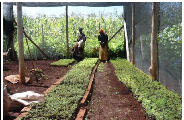
de jonge aanplant van bomen op Menofa