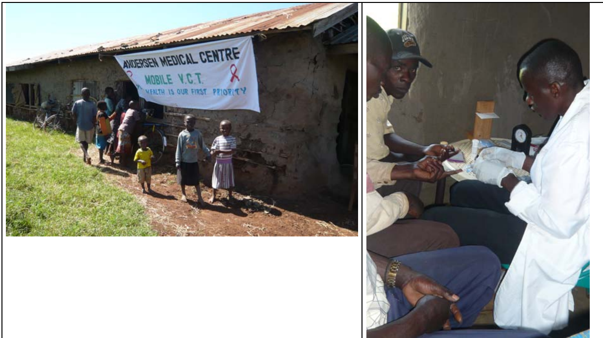
Het mobiele aids test centrum aan het werk.

Tot zover, een hele vruchtbare eerste week, wat een ervaringen en wat zijn we met zijn allen trots op het ziekenhuis en de school. We brengen hoop en dat laten de Kenianen je weten ook. Fijn om te mogen doen.