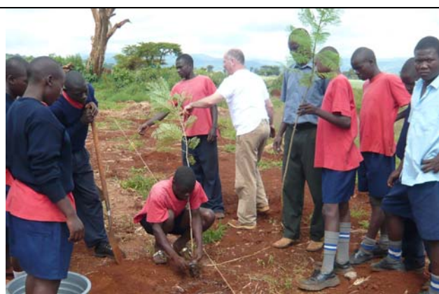
Planten van bomen op schoolterrein

Alle tafels en stoelen, computertafels, tekentafels, naaimachines, gereedschappen, spullen voor scheikunde, boeken enz. worden met een platte wagen verhuisd. Echter niet nadat ze schoongemaakt zijn, die schoonmaak verzorgt Ank met de meiden. Tja, die rolverdeling zit er blijkbaar diep in in deze wereld.