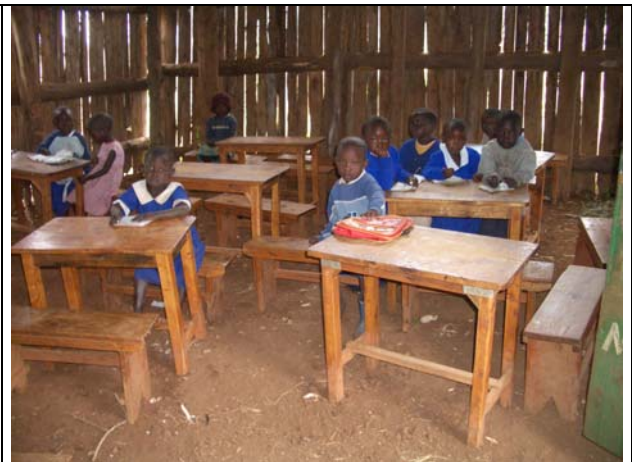
Zo zag het er 2 jaar geleden uit!

De overige aanpassingen van de laatste 2 jaar zijn. De 3 houten lokalen zijn vervangen door 3 nieuwe. Deze zijn veel beter dan de houten lokalen die uit stammen bestonden met alle geluidsoverlast van dien en veel tocht.